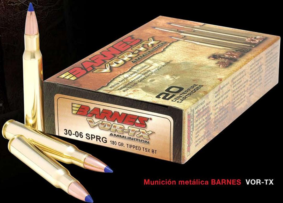
Munición metálica BARNES VOR-TX